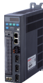
● 三轴伺服驱动器 CC-CAN 通讯总线